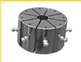
10 JEUX DE MORS